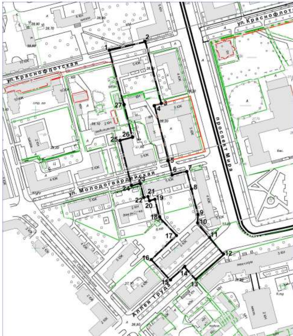
4.3. Координаты характерных (поворотных) точек границ ЗР (в местной системе координат (МСК-27))